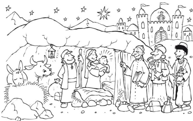
Ausrufbild zum Fest «Erscheinung des Herrn» - Dreikönige im Lesejahr A/Mi 2, 1-12

Was wissen wir über die Hl. Drei Könige? Im Matthäusevangelium ist von Sterndeutern die Rede, die aus dem Osten kommen, also keine Einheimischen. Ihnen wird durch den Stern der Weg gewie-