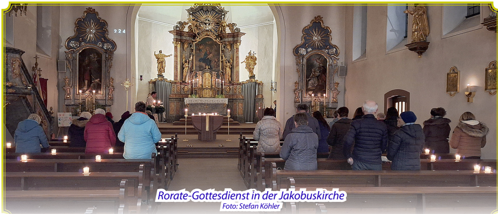
Rorate-Gottesdienst in der Jakobuskirche